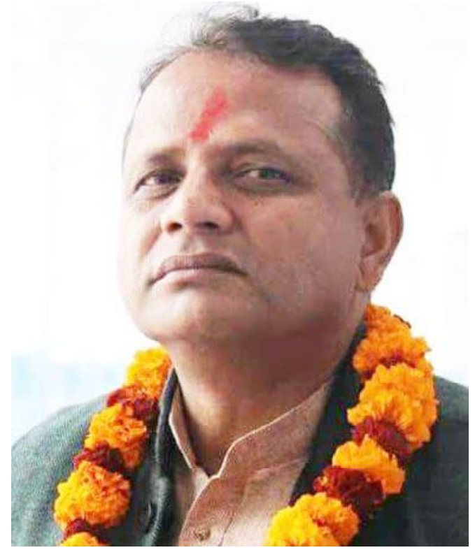
प्रदेश नं. २ का मुख्यमन्त्री लालबाबु राउत

- संविधानप्रति सबै नेपालीलाई अपनत्व महशुस गराउन सङ्घीय चरित्रलाई अवलम्बन गर्नु आवश्यक छ। यही जगमा जनताका अधिकारहरू सुनिश्चित हुनुपर्दछ। स्रोत र साधनले सम्पन्न गराई जीवनस्तरमाथि उठाउने र रोग, भोक र अभावबाट मुक्ति दिने लक्ष्यको निर्धारण आवश्यक छ। संविधानले दिएका अधिकारलाई यथार्थमा परिणत गर्न तीनै तहलाई बलियो बनाउदै संविधानका असन्तुष्टिका बुँदालाई सच्याएर सबैको पहुँच, आफ्नाका लागि आफैँबाट शासन, न्यायपूर्ण भूमि व्यवस्थापन, जातीय तथा लैङ्गिक भेदभावको अन्त्य, प्राकृतिक स्रोतसाधनमाथि स्वामित्व, अत्यसङ्ख्यकको अधिकार, समावेशी र समानुपातिक पद्धतिको व्यावहारिक धरातलमाथि अपनत्व महशुस गराउनु पर्दछ।